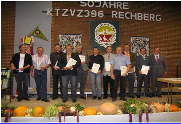
Bericht & Bilder: Helmut Bidlingmaier